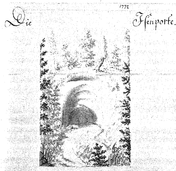
101. att. Johana Kristofa Broces 1772. gadā zīmētā Svētavota ala – senākais zināmais Latvijas alu zīmējums. BM01175a.

Alu divos sava darba “ Topographische Nachrichten von Lief- und Ehstland ” sējumos ir minējis arī Augusts Vilhelms Hupelis kā piemēru tēzei, ka dažas alas zemnieki uzskata par spēcīgām, t.i., izmanto to avotus dziedniecībā (Hupel 1777: 143). Plašākos Svētavota alas aprakstus tomēr publicēja dabas pētnieks Jākobs Benjamins Fišers. Vairākos viņa darba “ Versuch einer Naturgeschichte von Livland ” izdevumos ala ir raksturota trīs reizes, gan diskutējot par alas nosaukuma īsto variantu, gan aprakstot alu kā ģeoloģisku objektu, gan sīkāk raksturojot ar alas ūdens izmantošanu saistītās tradīcijas. Vairākas pazīmes liecina, ka savu Svētavota alas zīmējumu Broce vēlāk ir papildinājis ar aprakstu, kas pārņemts no Fišera darba.